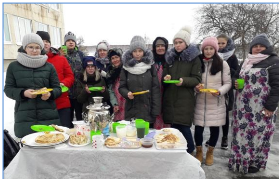
На фото: Праздник Масленицы в Новоисетской школе 29.02.2020г

Масленица – праздник восточных славян. Он существует на протяжении долгих веков и начинает историю с языческих времен. Идет он в течение недели перед Великим постом, проводится весело и задорно, с большими народными гуляниями, символизируя окончание зимы и приход весны. Блины являются его главным символом.