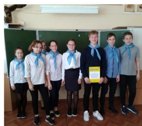
Победители: команда «Дружба» 1 место

Участники, объединились в 3 сборные команды 6,7,8 классов: «Импровизация», «Дружба», «DREAMs» (всего 27 учащихся).