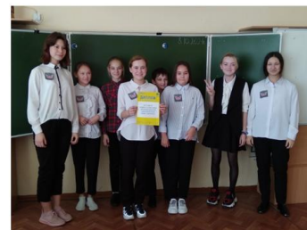
Команда «Импровизация» 2 место