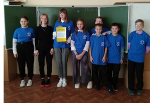
команда «DREAMs» 3 место